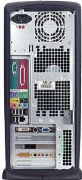
Das hinterteil ihres Computers ;-)

Die meisten Computer beziehen ihre Kühlung durch das hintere Netzteil hier wird Luft angesaugt und in das innere weiter geleitet, manch neues Modell hat noch extra Lüfter auf der Seite oder hinten.