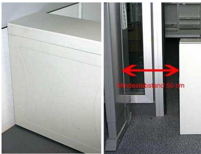
Abstand mindestens 50cm